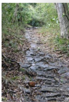
湯坂路(鎌倉古道)の石畳