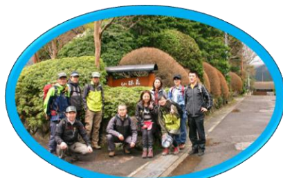
4月7日 雨も上がりいざ東海道へ