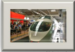
ロマンスカーで箱根湯本へ