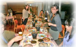
4月6日夜 外は神奈川観測史上最高の雨量