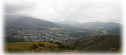
4月6日 こんな・・・天気でした