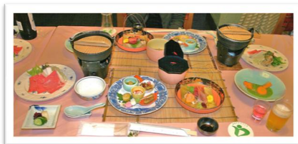
健保の宿 仙緑苑 4月の夕食