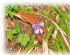
箱根のスミレ この時期多い・・・らしい