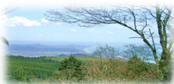
相模湾は白波が・・・写真じゃ見えない