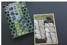
お昼は雨の中東海道名物『小鱈押寿司』