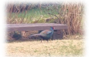
4月7日 朝食を食べていると、庭にキジ出現