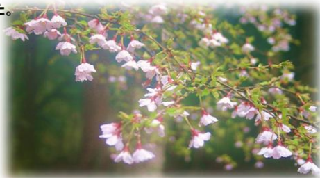
まめさくら(金時桜)