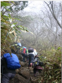
登って・・・また登る