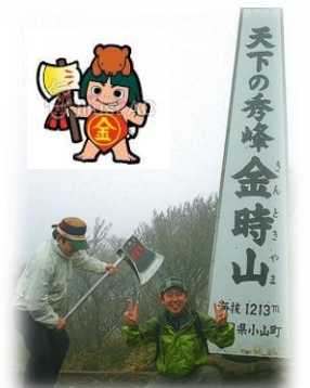
金太郎さんのまさかりで・・・