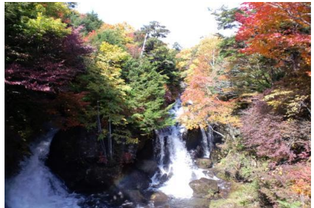
竜頭の滝 12:40 紅葉が美しい。