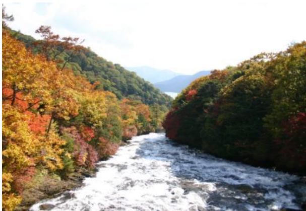
竜頭の滝上流。遠くに中禅寺湖が見えます。