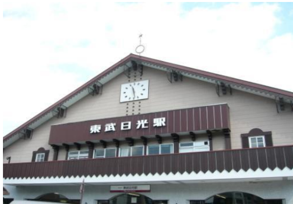
東武浅草駅 9:30⇒東武日光駅 11:18 到着！