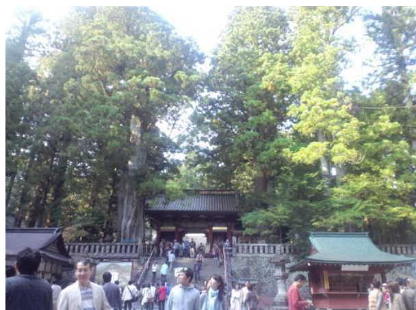
日光東照宮です。すごい人だかりです。