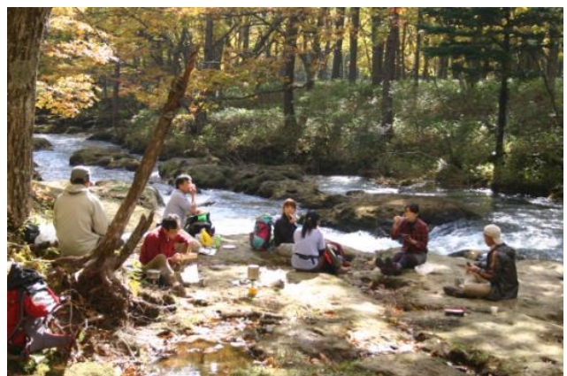
戦場ヶ原～湯滝の途中で昼食。