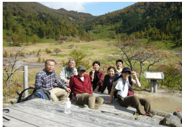
切込・刈込湖～山王峠途中にある窪地の休憩地