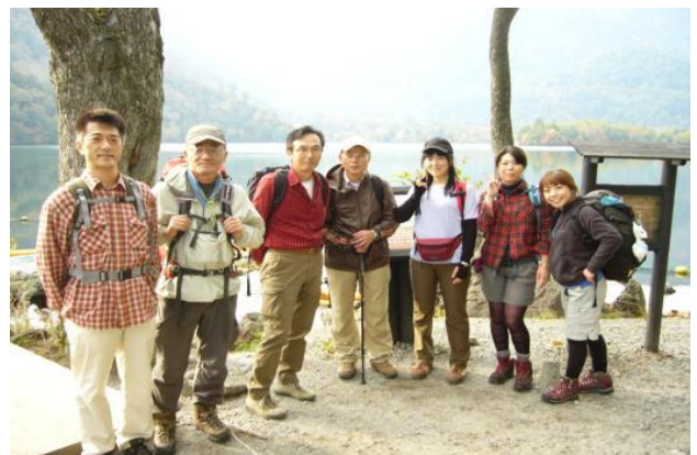
湯ノ湖 ⇒ 湯元温泉(湯ノ湖荘泊)