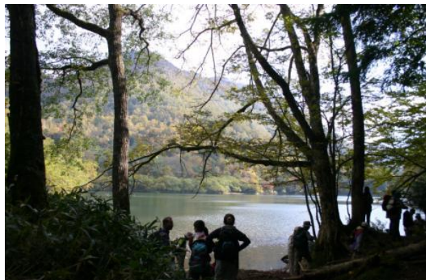
切込・刈込湖。対岸の紅葉が美しい。